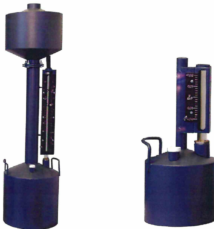
Рисунок 1 – Общий вид мерников

Пломбировка мерников осуществляется нанесением знака поверки давлением на свинцовые (пластмассовые) пломбы, установленные с помощью проволоки, проведенной через специальные отверстия в шкале мерника и в сливных кранах.