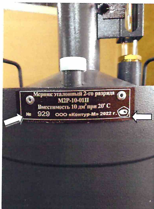
Рисунок 3 – Обозначения мест нанесения знака утверждения типа и заводского номера